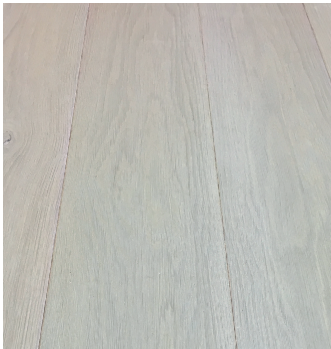
Ekgolv behandlat med Gammeldags Träsåpa Grå. Rengörs med Gammeldags Träsåpa Grå.

Den pigmenterade såpan passar speciellt bra till slutbehandling av golv som behandlats med Gammeldags Trälut, men även för underhåll och rengöring av golv behandlade med Timberex vit- eller gråpigmenterade oljor. Grå såpa är också mycket vackert på ek.