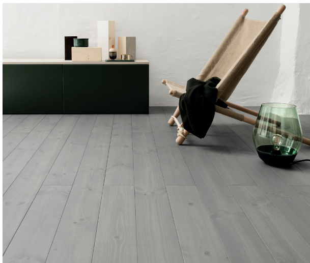
Furugolv förbehandlat med Gammeldags Trälut utan kalk, infärgat med grå Osmo Dekorvax och slutbehandlat med Osmo Hårdvaxolja 3065 ofärgad halvmatt.