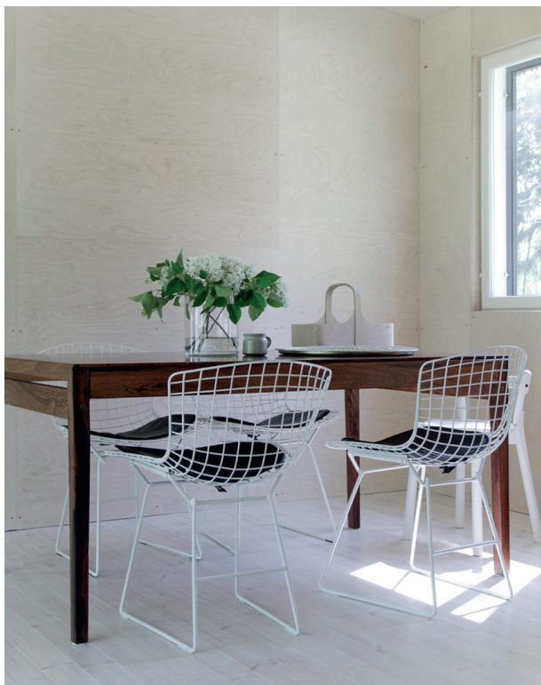
Furugolv förbehandlat med Gammeldags Trälut Vit och slutbehandlat med Osmo Hårdvaxolja 3062 ofärgad matt.